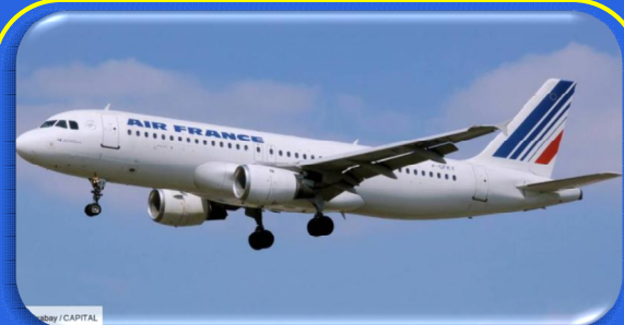
Airbus et Boeing pourraient vendre 160 avions à Air France-KLM !