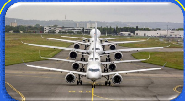
La filière aéronautique est "sortie d'affaire", un an et demi après le début de la crise sanitaire du Covid-19, assure le ministre de l'Economie Bruno Le Maire. Qui estime que "l'Etat français a sauvé Airbus"