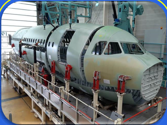
L'Airbus A321XLR prend forme

Cliquez sur une image pour ouvrir l'article :