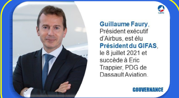
Guillaume Faury, Président exécutif d'Airbus, est élu Président du GIFAS , le 8 juillet 2021 et succède à Eric Trappier, PDG de Dassault Aviation.