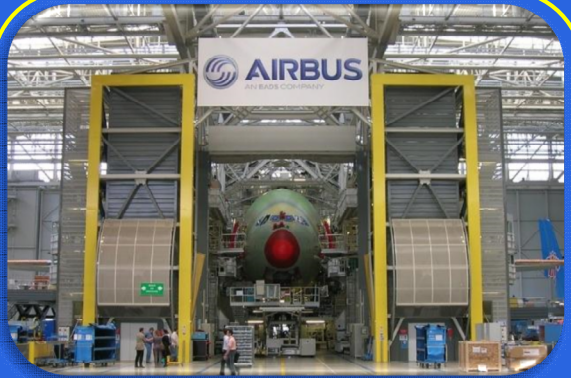
Airbus: nouvelle plateforme de formation des pilotes.