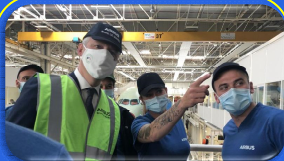
En visite sur le siège d'Airbus, Bruno Le Maire veut que "la filière aéronautique" reste n°1 mondiale